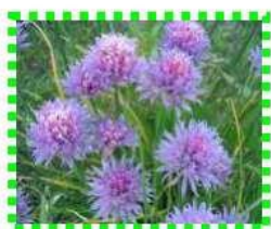
Лук - шнитт

выращивается круглый год. Известно множество сортов, включая живородящие ( Allium cepa var. viviparum ), т. е. образующие воздушные луковички, и многогнездные ( Allium cepa var. solaninum ), подземная «репка» которых состоит из нескольких самостоятельных луковиц.