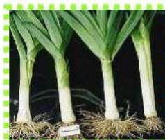
Лук - порей