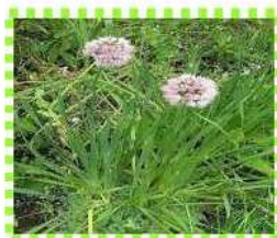
Лук - слизун