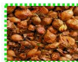
Лук - шалот